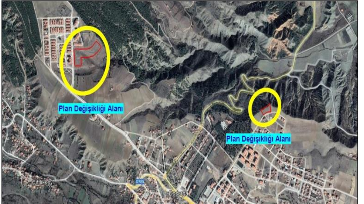
Şekil 1: Plan Değişikliği Alanı Konumu ve Yakın Çevresi